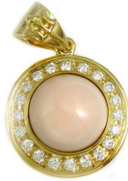
ไข่มุกแท้โดยธรรมชาติจาก 'หอยสังข์' ประดับล้อมเพชรกับยอดตรีศูล

สำหรับไข่มุกแท้ธรรมชาติที่ตีนั้น จะต้องได้รูปทรงกลมหรือรูปไข่ที่สวยงาม และจะต้องปราศจากตำหนิใดๆ ไข่มุกแท้ตามธรรมชาตินั้น นับว่าเป็นสิ่งมีชีวิตจริงๆ และเป็นสิ่งที่เป็นความมหัศจรรย์ และไข่มุกธรรมชาติที่สมบูรณ์นั้นหาได้ยากมากเปรียบได้กับหนึ่งในล้านเลยทีเดียว